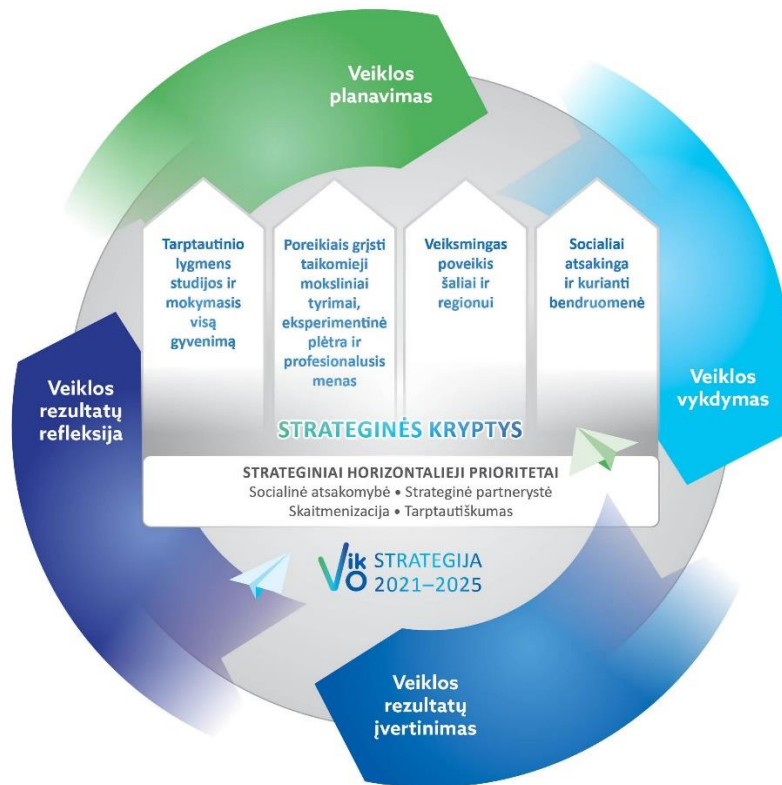
4 pav. Kolegijos veiklos valdymo ciklas