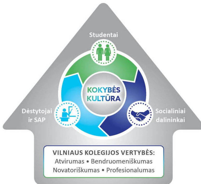
2 pav. Kokybės kultūros vystymas