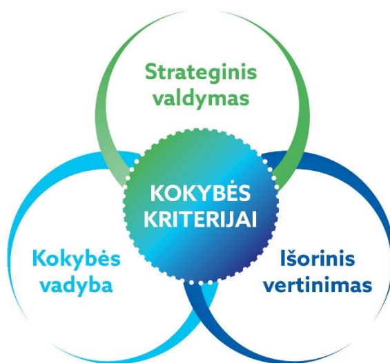
6 pav. Strateginio valdymo, kokybės vadybos ir išorinio vertinimo sąveika

Kolegijos veiklos vertinimo ir studijų programų, kryptių vertinimo kriterijai yra derinami su Kolegijos strateginiais tikslais ir atitinkamais išorinio vertinimo (akreditavimo) kriterijais.